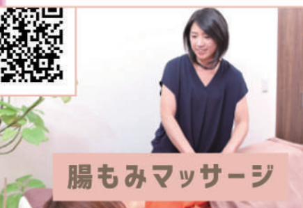
腸もみマッサージ